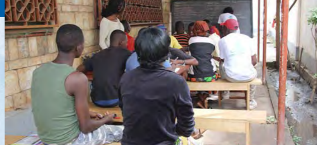
Educación a antiguos niños/as soldados rescatados en R. Centroafricana