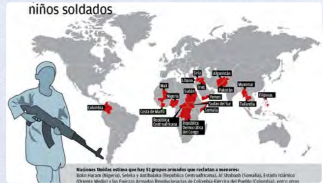
Boko Haram es una de las mayores organizaciones en captura de niños para soldados.