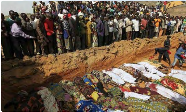
Enterramiento masivo de 21 católicos nigerianos asesinados el pasado mes de abril.