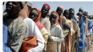
Refugiados nigerianos hacen cola en un campo de refugiados.

En el contexto de este vil atentado de Boko Haram, hay que recordar que al menos 90.000 nigerianos han tenido que huir de sus hogares y refugiarse en países limítrofes como Camerún en campos de refugiados. Boko Haram se ha hecho con el control de las comunidades del noroeste del país, infiltrándose en poblados y asesinando a sangre fría a todos aquellos que no se convierten al Islam; instaurando un verdadero califato de horror.