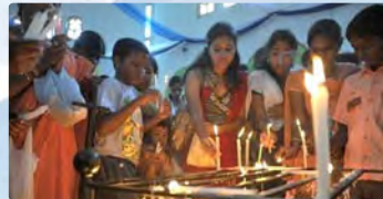
Cristianos católicos celebran la Natividad de la Virgen en India.

Si los cristianos no se convierten al hinduismo, “deben irse de aquí”, que es una de las habituales amenazas que recibe la comunidad cristiana. La violencia en la India contra los cristianos es cada vez más explícita y radical, informa la agencia Asic. En los primeros 5 meses de 2018 fueron registrados 101 episodios de violencia contra la comunidad cristiana, así como amenazas e intimidaciones. También, se manifestaron ataques y agresiones contra encuentros pacíficos de cristianos reunidos en oración, que afectan especialmente a mujeres y niños. Persecution Relief ha llegado a contar más de 1.200 en los últimos dos años; de los cuales cerca de 60 fueron registrados en sólo nueve meses en Uttar Pradesh, el Estado gobernado por un santón hindú, famoso por su hostilidad hacia los que creen en Cristo. Según informó AsiaNews, el pastor Shibu Thomas , fundador de ‘Persecution Relief’, afirmó que cientos de miles de personas han participado en una semana de oración pidiendo la liberación de aproximadamente 100 pastores y fieles que se encuentran recluidos en cárceles, acusados falsamente de realizar conversiones forzadas.