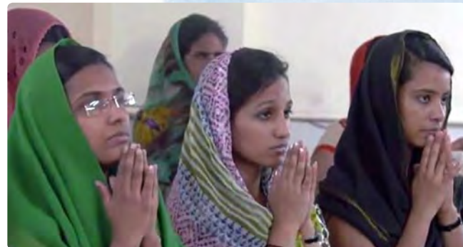
Mujeres cristianas en India en oración.

Cuenta SIT-España, Orden Stma. Trinidad Banco Popular: ES85 0075 0010 08 0703873352 BBVA: ES66 0182 1344 96 0200019370