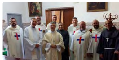
Religiosos trinitarios junto al arzobispo de Tánger en la toma de posesión en Alhucema.

El pasado día 12 de octubre se reunía en Madrid la comisión de Sit España formada por miembros de la Familia Trinitaria. Es la primera reunión de este curso donde se revisó, evaluó y siguió los proyectos que Sit España tiene en marcha en diferentes partes del mundo. Entre muchos asuntos y decisiones se impulsó la campaña “cada 5 minutos”; el nuevo proyecto de “La Esperanza” en Bartella (Irak) con la finalidad de ayudar a volver a los cristianos perseguidos en esa región; la participación e incorporación de las hermanas trinitarias contemplativas dentro de la logística de SIT y su presencia en estas reuniones; se revisaron los medios y redes sociales de difusión y se aprobaron medidas de ampliación, para poder hacerse más presentes en diversos sectores de la sociedad y la Iglesia...etc. SIT ve en la reciente presencia trinitaria en Marruecos, con su finalidad de acompañamiento de cristianos y el diálogo entre religiones en un país de mayoría musulmana, una conexión esencial con el carisma trinitario y el ser existencial de este organismo de la Familia Trinitaria presente en lugares de persecución o dificultad en libertad religiosa. Se aprobaron medidas económicas importantes para ayudar a sostener esta presencia en tierras marroquíes, al igual que servirán para futuros proyectos que se quieran realizar. Dos religiosos trinitarios comenzarán la presencia en Marruecos, los padres Manuel Cánovas y Evelio Díaz.