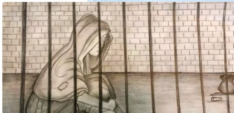
Unidos en oración a todos los cristianos que sufren prisión por su fe.

También puedes colaborar aportando tu donativo a: Cuenta SIT-España, Orden Stma. Trinidad Banco Popular: ES85 0075 0010 08 0703873352 BBVA: ES66 0182 1344 96 0200019370