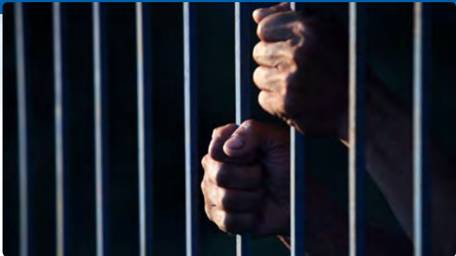
Cristianos convertidos llenan las cárceles de algunos países, más de 3000 según organizaciones como Puertas Abiertas. Sólo en India hay más de 600 que esperan juicio.