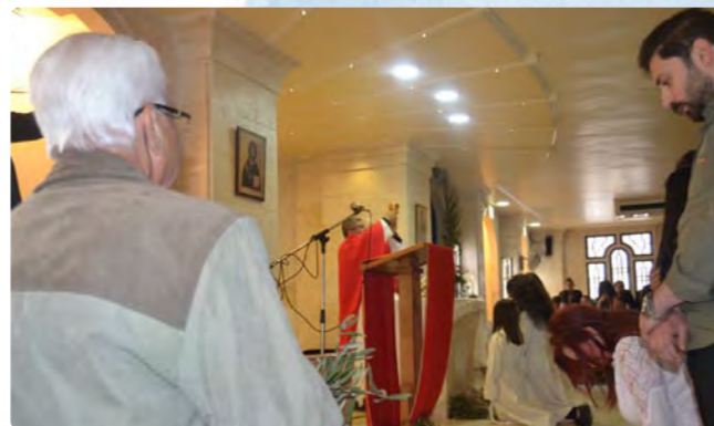
Oración, recogimiento y eucaristía en la iglesia de La Anunciación de Alepo, Siria.

También puedes colaborar aportando tu donativo a: Cuenta SIT-España, Orden Stma. Trinidad Banco Popular: ES85 0075 0010 08 0703873352 BBVA: ES66 0182 1344 96 0200019370