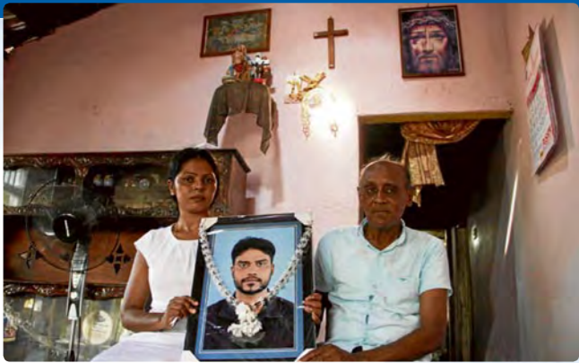
Familia muestra a uno de sus seres queridos asesinado en los atentados, mártir de la Iglesia de hoy.