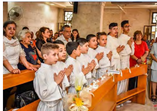
Niños de la parroquia de La Anunciación hacen su primera comunión. Son las primeras después de ocho años.