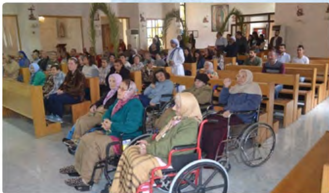
Personas ancianas y enfermas orando en una celebración en Alepo.