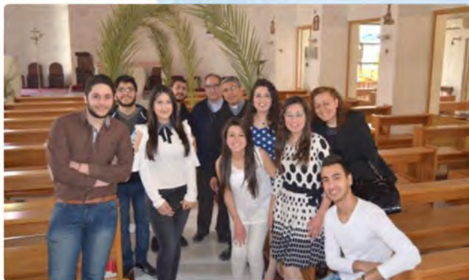
Jóvenes cristianos refugiados en Alepo después de la eucaristía dominical.

También puedes colaborar aportando tu donativo a: Cuenta SIT-España, Orden Stma. Trinidad Santander: ES85 0075 0010 08 0703873352 BBVA: ES66 0182 1344 96 0200019370