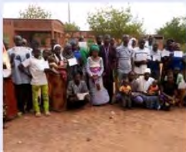
Cristianos refugiados en Burkina Faso