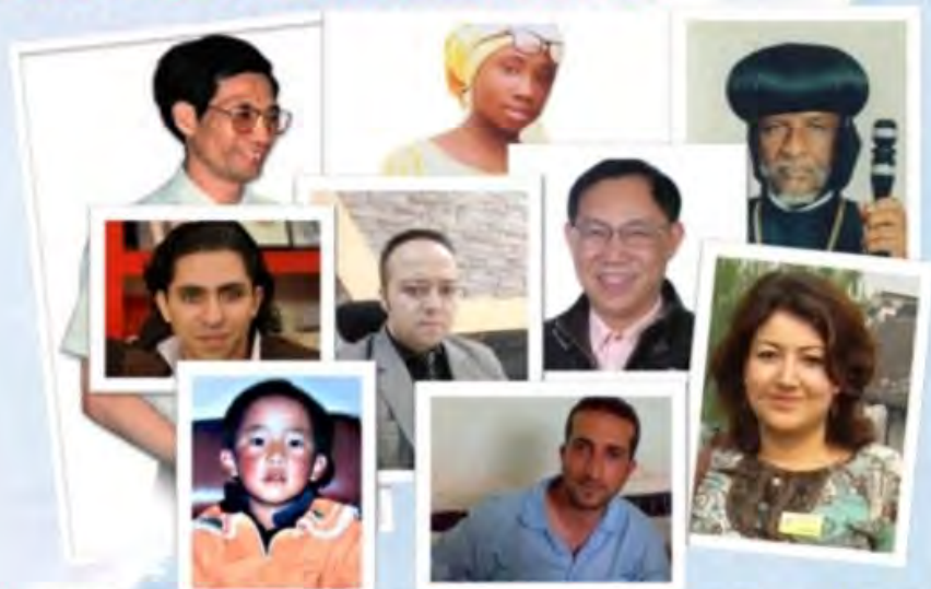
Personas encarceladas por conciencia religiosa en el mundo. Comisión para la Libertad Religiosa de EEUU. (Sit-España)

L a comisión de Libertad Religiosa de Estados Unidos acaba de iniciar un nuevo proyecto donde pretende hacer una base de datos sobre personas encarceladas o secuestradas por conciencia religiosa. La base de datos podrá ser consultada en su web de internet libremente e incluso se podrá colaborar con nuevas aportaciones o colaborar en su liberación. Para ello se designa por cada cautivo una persona de contacto. La página web aporta la situación del prisionero, procedencia, causa, religión, biografía y todos las actuaciones que se han hecho para su liberación. No es algo nuevo, ya que otras organizaciones, como Amnistía Internacional o la Voz de los Martires en su sección "Alerta prisioneros", también aportan datos sobre personas encarceladas por motivos religiosos . Pero todo es poco para seguir luchando por la libertad de tantas personas encarceladas o secuestradas injustamente. Dada la magnitud de esta Comisión de Libertad Religiosa de EEUU esperamos que sea un lugar donde dar a conocer a nuestros hermanos cristianos cautivos por su fe y buscar actuaciones para su liberación. (Sit-España)