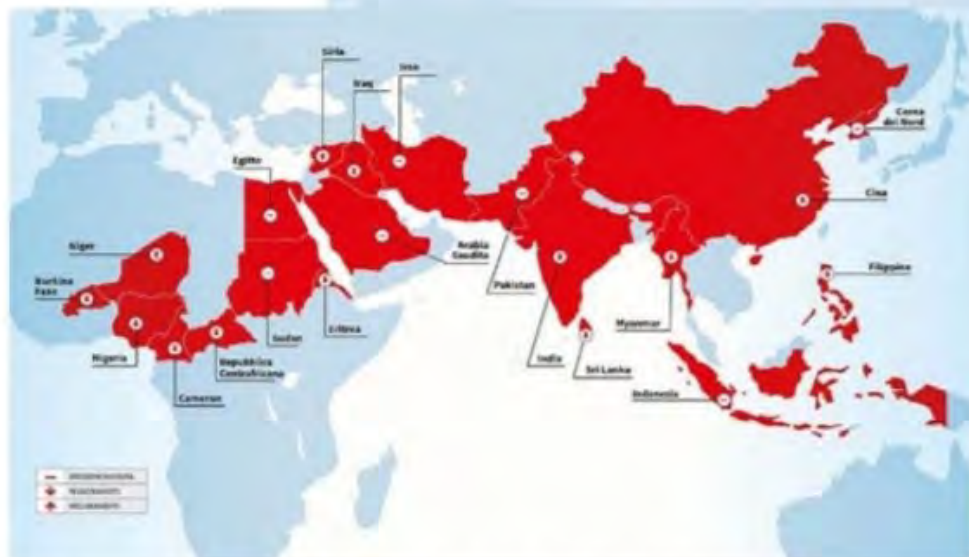
Mapa mundial de persecuciones más graves contra cristianos 2109