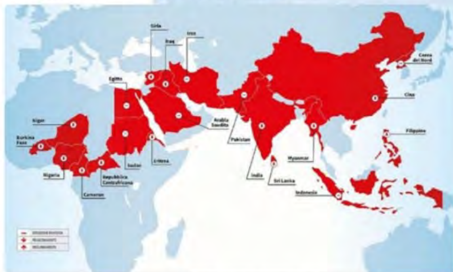
Mapa mundial de persecuciones más graves contra cristianos 2019