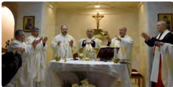
Inauguración de la Parroquia de Ntra. Sra. de La Anunciación y Centro social de Midan en navidad de 2018.