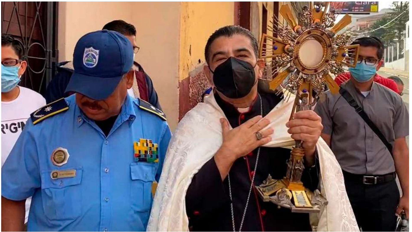
Las dificultades para las celebraciones religiosas han ido en aumento en Nicaragua

¿Ser católico en Nicaragua hoy es un riesgo, una esperanza o una Cruz que hay que simplemente tomar sobre los hombros?