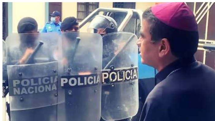
La presión de las fuerzas de seguridad sobre monseñor Rolando Álvarez llegó a la puerta de los templos

Hay varios actores relevantes para este escenario futuro. Los grandes empresarios deben ser parte del cambio; su unidad y su compromiso con el bienestar del pueblo nicaragüense tendrá un papel importante. El exilio, la diáspora nicaragüense debe convencer con la esperanza al pueblo y motivarle transmitiendo unidad y liderazgo. Otro elemento es el factor religioso. La Conferencia Episcopal, los obispos, los sacerdotes deben estar en alerta acompañando al pueblo santo de Dios... ¿Cómo queda la libertad religiosa? De momento está condicionada. Del futuro, ¿qué se espera?... pues que los cristianos vivan su fe como los primeros siglos de la cristiandad, es decir,... se habla de Cristo, pero desde el anonimato, más en familia, más en pequeños núcleos o pequeñas células y siempre bajo ese temor de que por hablar de la verdad, por hablar de Cristo seas perseguido.