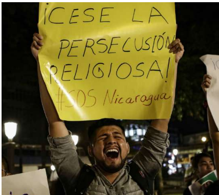
Los cristianos nicaragüenses reclaman el fin de la persecución religiosa

Comienza con un acto de denuncia profética y de caridad cristiana, es decir cuando los líderes religiosos (obispos, sacerdotes, religiosos y religiosas, etc.) en el año 2018 denuncian las injusticias que cometía el régimen de Nicaragua. Y por abrir las puertas de los templos para resguardar la vida de los manifestantes que fueron atacados con armas de fuego,... otros habían sido asesinados solo por el hecho de no estar de acuerdo con las políticas arbitrarias y dictatoriales ejecutadas por más de una década.