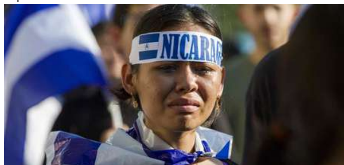
Los cristianos nicaragüenses lloran pero sufren con firmeza la presión del Gobierno de Ortega