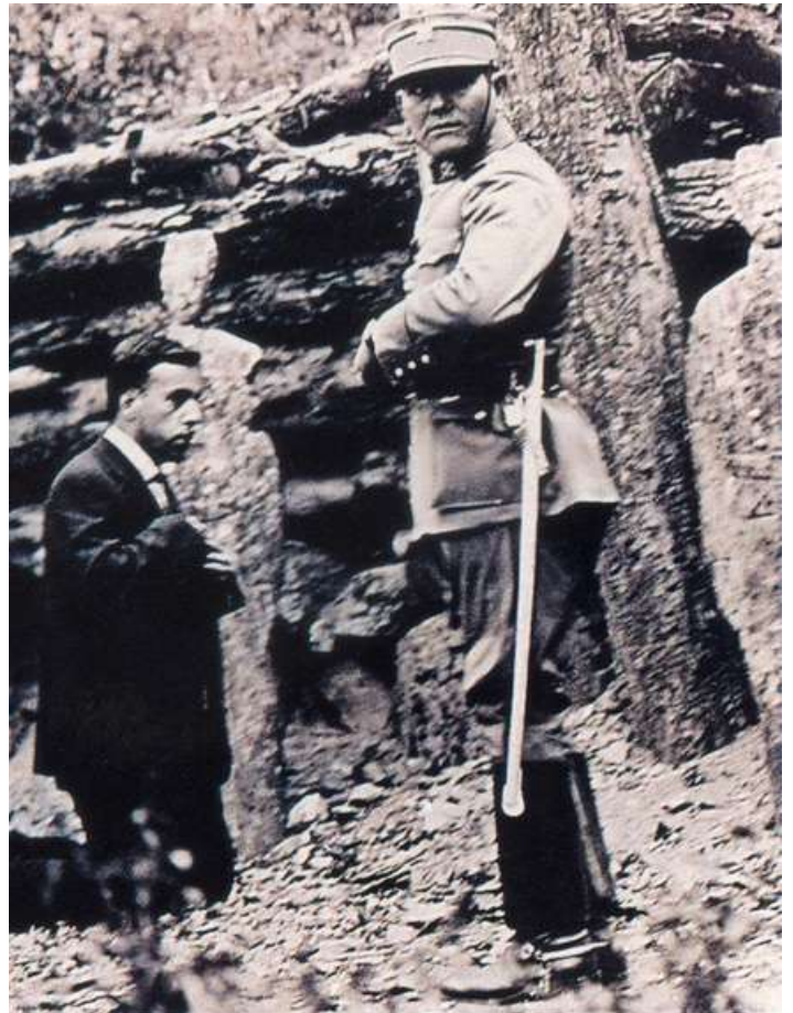
Cristero ante su fusilamiento.

Fueron miles los mártires de la persecución religiosa asesinados a sangre fría por odio a la fe. Decenas de ellos ya están en los altares tras haber sido beatificados o canonizados por los últimos Papas.