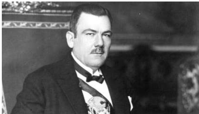
Plutarco Elías Calles, presidente de Méjico (1924-1928)

Un hito relevante de este proceso que explica la Cristiada fue la promulgación de la Constitución de 1917. La carta magna afectó a la Iglesia católica en el ámbito político, el jurídico, el patrimonial y el educativo. Su objetivo: eliminar el mensaje evangélico en tierras mejicanas y restringir su presencia en la sociedad. A la Iglesia se le negó personalidad jurídica, se le prohibió establecer o dirigir centros de enseñanza, tener órdenes monásticas, adquirir, poseer o administrar bienes raíces (los que tuvieran serían expropiados) o editar periódicos difusores de noticias políticas o institucionales. Los religiosos no podían patrocinar, dirigir o administrar instituciones de auxilio social o instituciones científicas, les estaba vetado la crítica a las leyes, a las autoridades o al Gobierno, asociarse con fines políticos o heredar por testamento. El objetivo final era eliminar la presencia de la Iglesia en la sociedad atacando a la libertad religiosa: educación laica, prohibición de corporaciones religiosas, de votos religiosos, celebración del culto público solo dentro de los templos y siempre bajo la vigilancia de las autoridades, reserva del ejercicio del sacerdocio solo a los mejicanos por nacimiento, etc.