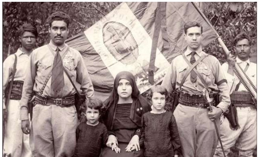
Cristeros con el estandarte de la Virgen de Guadalupe)