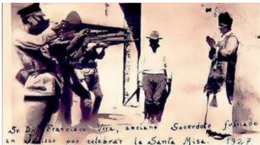
Sacerdote fusilado durante la Cristiada por celebrar misa, 1927.

La Guerra Cristera llegó a su fin en 1929, tras la llegada al Gobierno un año antes de Emilio Portes Gil. Las negociaciones previas fueron auspiciadas por los EEUU y la Santa Sede, y así el 21 de junio se firmaron unos acuerdos redactados por Dwight W. Morrow, el embajador estadounidense en México. Los firmantes fueron el presidente Portes Gil, el arzobispo de Michoacán y delegado apostólico Leopoldo Ruiz y el obispo de Tabasco, Pascual Díaz. El acuerdo suponía la salida del país de los preladados que habían apoyado abiertamente el levantamiento a cambio de una amnistía para los cristeros.