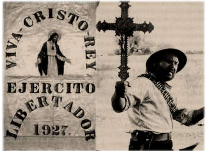
Lema de los cristeros

ministros del culto no podían, en reunión pública o privada, hacer crítica de las leyes del país, de sus autoridades o específicamente del Gobierno. La infracción de este precepto llevaba aparejada la pena de prisión de 1 a 5 años.