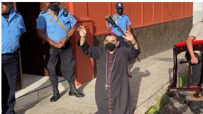
En agosto de 2022, monseñor R. Álvarez fue condenado a 26 años de prisión por "traición a la patria"

Creo que consideran la situación de Nicaragua más un tema político... Muy poco se me pregunta o se nos pregunta a los nicaragüenses... sobre cómo hacen los creyentes en Nicaragua para celebrar, sobre las prohibiciones de las procesiones,... sobre que los sacerdotes que no se puedan reunir para hacer grandes concentraciones, para realizar charlas, seminarios, conciertos cristianos, etc. La verdad, percibo muy poco interés.