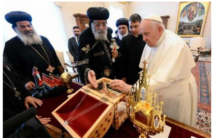
Entrega de reliquias de mártires coptos